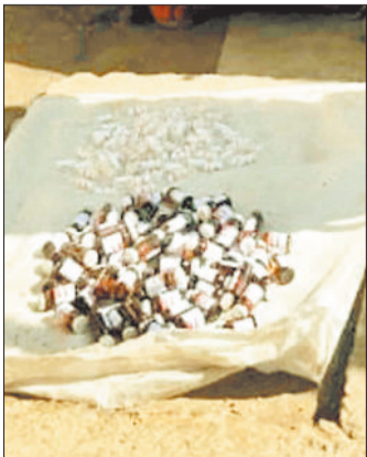
जब नशीले इंजेक्शन।