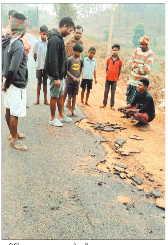
नवनिर्मित सड़क का डामर उखाड़ते ग्रामीण।

विशेष संरक्षित पण्डो एवं कोरवा समुदाय के लोगों को विकास की मुख्यधारा से जोड़ने के उद्देश्य से शासन ने प्रधानमंत्री जनमन योजना के तहत सड़क निर्माण की र-वी कृ ति प्रदान की है। ठे के दा र स ड क निर्माण में विभाग द्वारा निर्धारित गुणवत्ता का पालन नहीं करने से बनने के साथ ही सड़क उखड़ने लगी है। क्षेत्र के ग्रामीणों ने ठेकेदार पर मनमानी निर्माण करने का आरोप लगाया है। विशेष संरक्षित जनजाति पहाड़ी कोरवा एवं पण्डो समुदाय को विकास की मुख्यधारा से जोड़ने शासन ने पीएम जनमन योजना अंतर्गत ग्राम पंचायत असकरा से मड़वा सड़क एवं ग्राम पंचायत कुनिया से भुसाखोल तक प्रधानमंत्री ग्रामीण सड़क योजना के तहत जनमन सड़क निर्माण की स्वीकृति प्रदान की है। ठेकेदारों ने सड़क का निर्माण भी प्रारंभ कर दिया है लेकिन गुणवत्ताही निर्माण होने के कारण पैदल चलने पर भी सड़क की गिट्टी उखड़ रही है। दस दिनों पूर्व