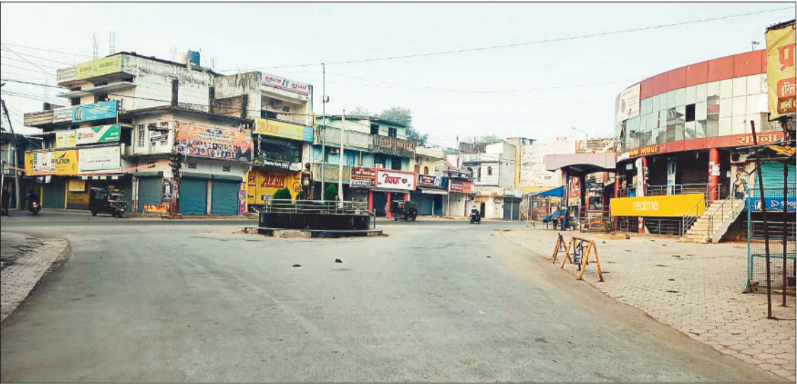
हरिभूमि न्यूज ▶▶ बैकुण्ठपुर

अब कोरिया जिले की सड़कों पर ट्रैफिक नियम तोड़ना आसान नहीं होगा। कोरिया जिले में यातायात व्यवस्था को और अधिक सुरक्षित व पारदर्शी बनाने के उद्देश्य से 6 प्रमुख स्थानों पर अत्याधुनिक कैमरे लगाए जाने की तैयारियां शुरू हो गई हैं। इन कैमरों के जरिए वाहनों की ऑटोमैटिक स्कैनिंग होगी और बिना इंश्योरेंस, नियमों का उल्लंघन या अन्य दस्तावेजों में कमी पाए जाने पर सीधे ई-चालान कटेगा। कैमरे वाहन नंबर प्लेट को स्कैन करेंगे, जिसके आधार पर वाहन का इंश्योरेंस, पंजीयन, प्रदूषण प्रमाण पत्र सहित अन्य